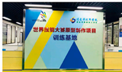
世界技能大赛原型制作项目训练基地