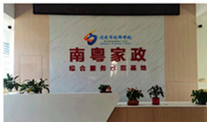
南粤家政培训基地