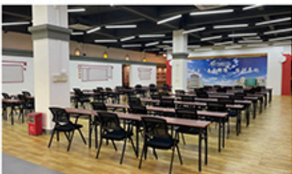
省级“粤菜师傅”培训基地